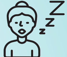
Dolor de cuerpo y fatiga